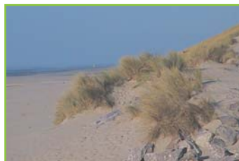
4 En 1920, le domaine (voir ci-contre) était traversé par trois larges cordons de dunes parallèles à la côte. Seuls quelques chemins sillonnaient les dunes et n'étaient empruntés que par les pêcheurs.