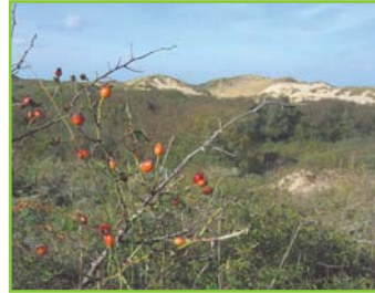
L'églantier ou rosier des chiens, très présent dans les dunes grises.