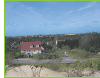
Panorama sur Stella-plage, le littoral et l'arrière pays depuis les dunes proches du réservoir.