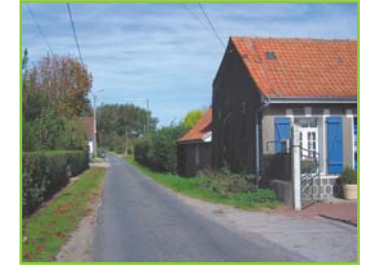
Traversée bucolique du quartier du Bout de haut