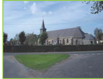
1 L'église de Cucq...